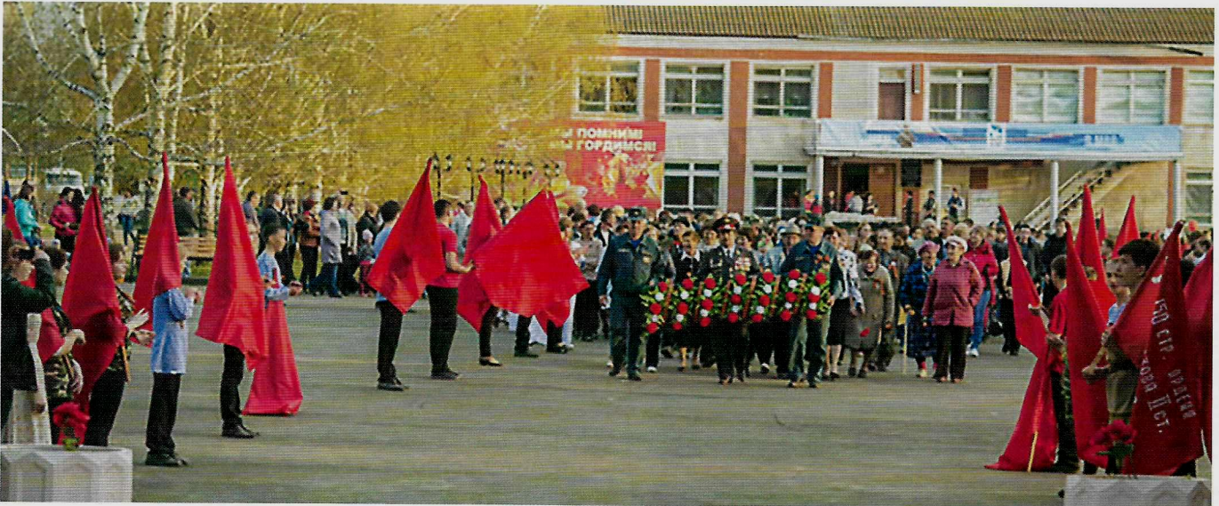
Торжественное открытие в Солонешном Парка Победы 7 мая 2015 года.

прижимать наших бойцов к земле. Михаил Паршин вскочил и коротким броском... грудью закрыл амбразуру. Фашистский пулемёт смолк. В ту же секунду наши солдаты поднялись в атаку и разгромили врага.