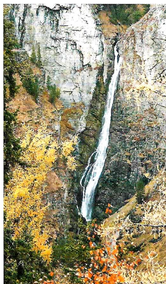
Каскад водопадов на р.Шинок.

пы древней истории – от раннего палеолита до средневековья. Слои содержат фрагменты разнообразных каменных и костяных орудий, украшений из костей и зубов животных, керамической посуды, предметов вооружения из бронзы и железа, а также многочисленные кости древнейших животных, остатки растений, то есть следы обитания первобытного человека, возраст которых составляет сотни тысяч лет. Перекрывают их культурные слои, связанные с обитанием в пещере древних сообществ бронзового века, скифского и гунно-сарматского времён и эпохи средневековья.