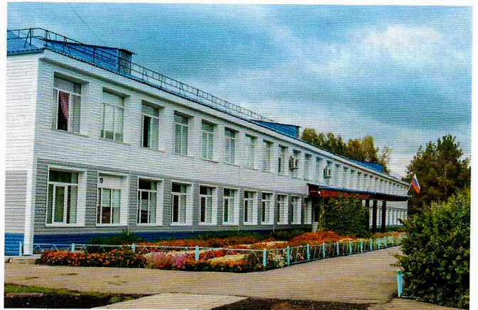
Солонешенская средняя общеобразовательная школа.

В 1924г. на территории района организуются первые комитеты бедноты, пункты по ликвидации неграмотности в Солонешном, Черемшан-